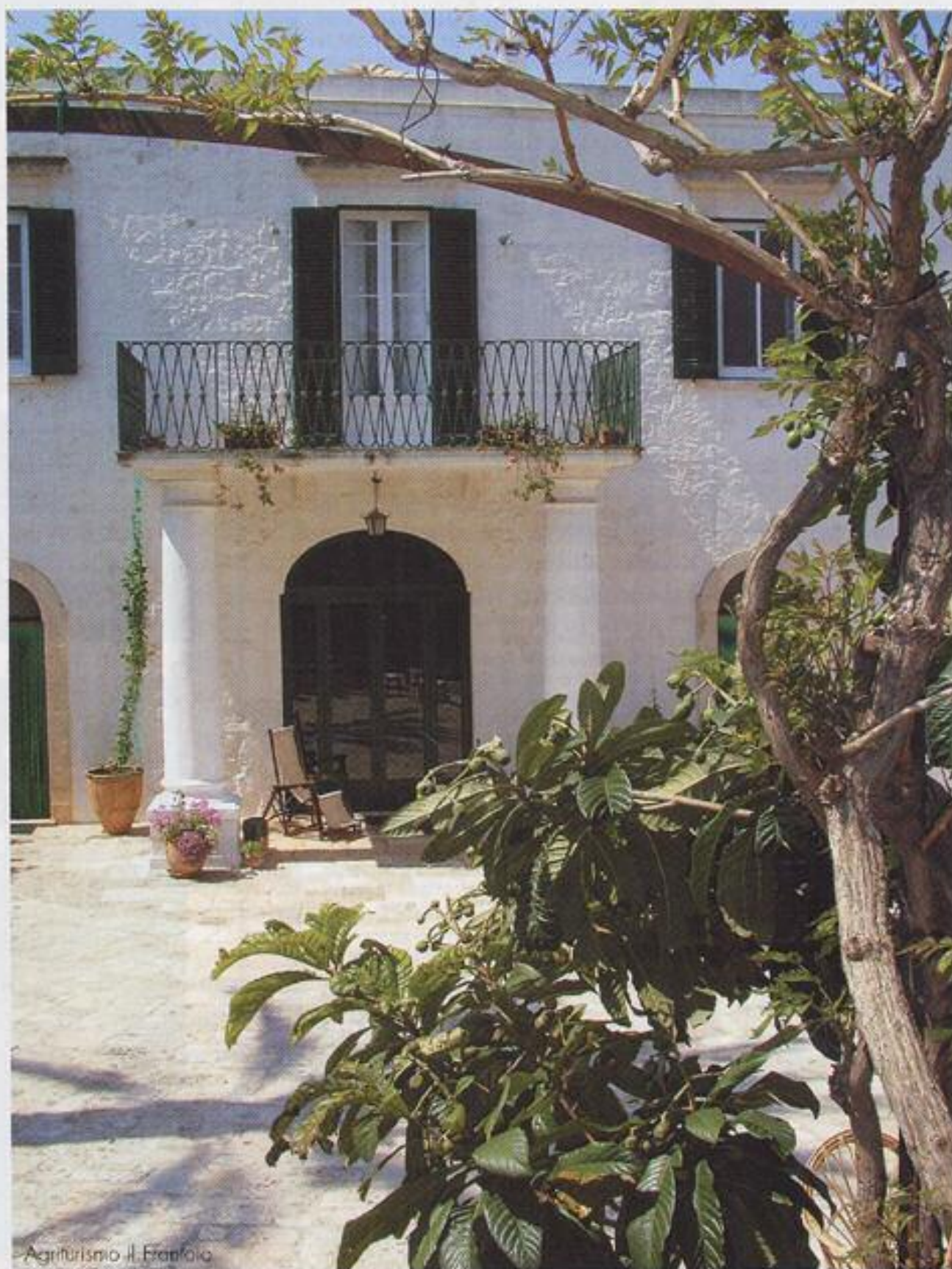
Agriturismo Il Frantoio

La masseria è la fattoria storica e caratteristica del territorio pugliese e rappresenta oggi la più importante realtà nell'ospitalità turistica di questa regione. Bianca e distribuita in larghezza più che in altezza, con diversi edifici collegati da arcate e portici, la masseria ha l'impianto architettonico ideale per un turismo moderno, che richiede non solo camere e ristorante, ma anche ambienti per il relax e il tempo libero, oltre ad ampi spazi all'aria aperta. Nella maggior parte dei casi, la presenza di molti ettari di proprietà impiegati in attività agricole e zootecniche ha fatto propendere i pugliesi verso l'accoglienza di tipo agriturismo, nel rispetto delle normative e dei requisiti essenziali quali quello dell'utilizzo delle materie prime aziendali e della maggiore rilevanza economica dell'attività agricola rispetto a quella turistica. Così, nella campagna, ma a pochi chilometri dalle spiagge e dal mare, gli agriturismi della Puglia offrono ai visitatori un contatto diretto con la terra e con una gastronomia che nasce da ingredienti d'eccezione. L'olio extravergine di oliva, tanto per cominciare, ma anche vini e formaggi freschi (mozzarella, burrata, caprini), ricotte, caciotte e caciocavalli e squisite verdure dell'orto, messe sottolio o cucinate con gran fantasia, che sono la costante del ristoro agriturismo pugliese.